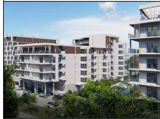
MIESZKANIE NR 30